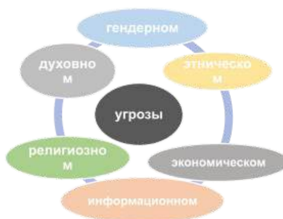
Рис. 2: Угрозы психологической незащищенности учащихся (составлен авторами).

уязвимости учащихся в гендерном плане, этническом, экономическом, информационном, духовном, религиозном плане, которые могут способствовать гендерной, этнической, религиозной, экономической дискриминации, негативному воздействию деструктивной информации Интернета на личность, что накладывают определенный отпечаток на психологическую устойчивость школьника. Эта сторона вопроса недостаточно изучена и требует к себе более глубокого подхода. (см.рис.2).